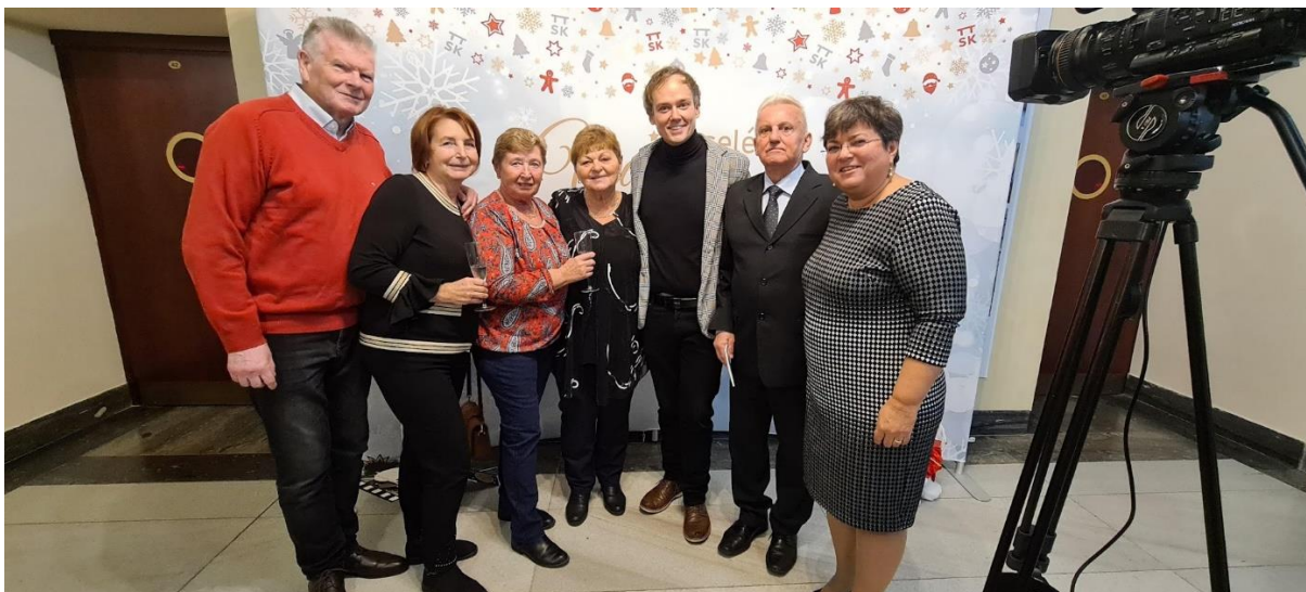
Niektorí účastníci divadelného predstavenia

Za umelecký zážitok veľmi pekne ďakujeme všetkým hercom, že sme virtuálne spolu s Palárikom prešli po niektorých jeho životných zastávkach od Rakovej - rodiska , cez Banskú Štiavnicu, Ostrihom a Pešť až po Majcichov, kde napokon ako miestny farár, zložil predčasne svoje kosti. 5