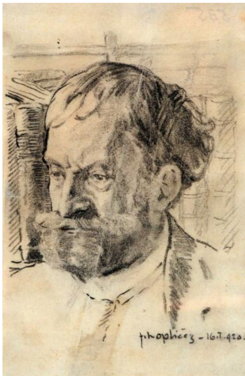
Ferko Urbánek (1859 - 1934) 11

Z vyššie spomenutého plným právom tu oddnes bude Urbánkova busta bok po boku Schneidrovej, ktorý v ňom za života i po smrti videl svojho milovaného a populárneho slovenského spisovateľa, jednoducho baťka. 12